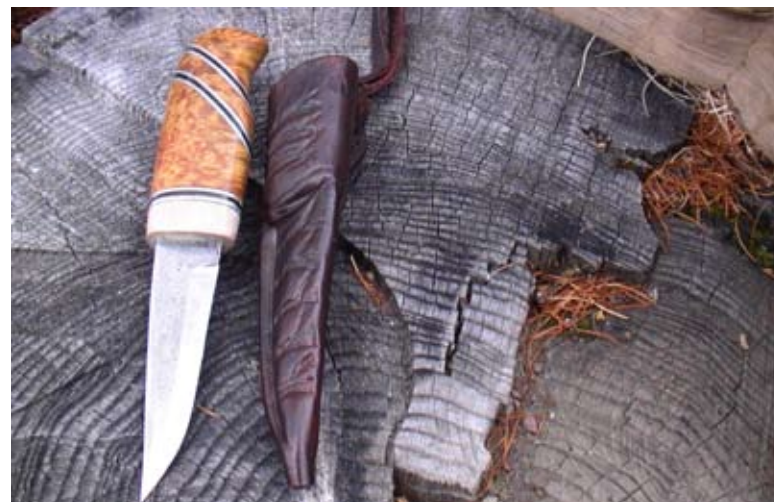
HANDSMITT BLAD I KOLSTÅL, SKAFT AV SÄLGRÖT, ÄLGHORN SAMT MELLANLÄGG AV TENN OCH SVART VULCANPAPP.