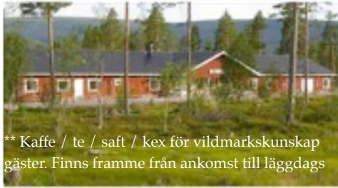
** Kaffe / te / saft / kex för vildmarkskunskap gäster. Finns framme från ankomst till läggdags

All boende på Sälens Vandrarhem i egna rum. Alla aktiviteter sker i eller omkring Gräsheden